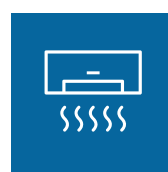
Przepływ powietrza SMART