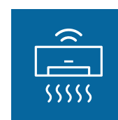
Kontrola przepływu powietrza